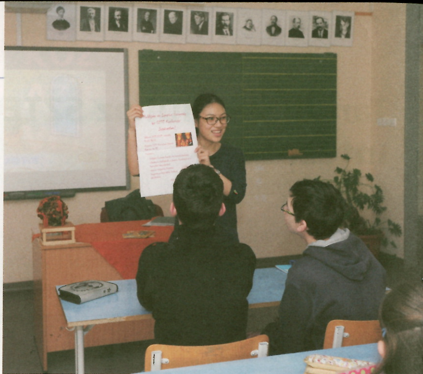
Az SZTE Konfuciusz Intézetben kínai oktatók segítségével sajátíthatjuk el a nyelvet.

Nagy Édatól megtudtuk, egy alapfokú nyelvtanfolyam hat modulból áll, a Szegedi Tudományegyetem Konfuciusz Intézetében a legmagasabb szinten a negyedik modulnál tartanak a tanulók. A diákoknak